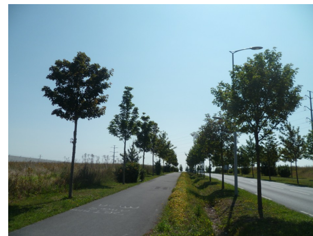
Erables Avenue Jean Monet