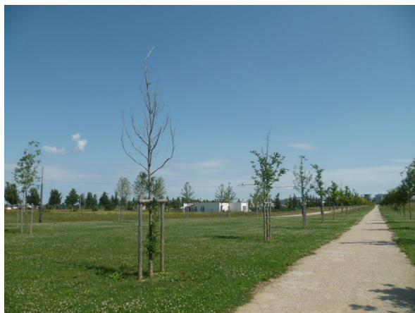
Arbres dépérissants au mail piétonnier

L'état sanitaire général est bon. Mais certains sites sont à surveiller notamment au niveau du mail piétonnier. De nombreux arbres sont dépérissants. Plusieurs maladies et ravageurs ont été observés : la chalarose du frêne sur les Fraxinus excelsior , différents champignons et des dégâts de campagnols des champs au niveau des mottes.