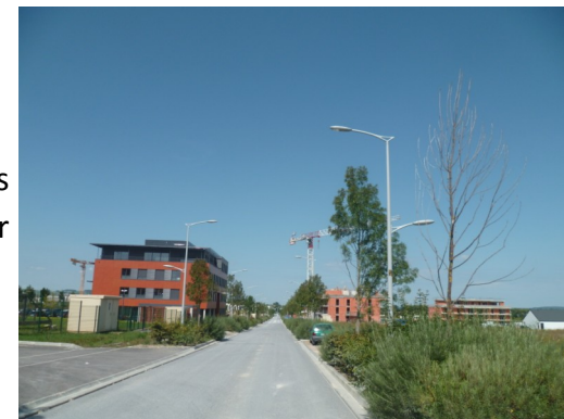
Arbres morts Rue Victor de Brooglie