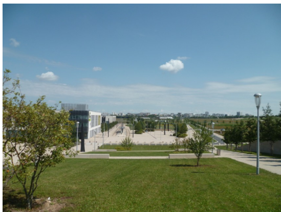
Vue du Parc d'affaires de la gare TGV

Le parc de la Roselière représente 5.35 % du patrimoine du Parc d'affaires avec 351 arbres.