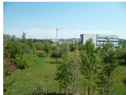
Vue du bassin d'infiltration

L'état sanitaire des arbres est bon. Certains arbres situés le long des voies ont souffert de la circulation lors des travaux et présentent des branches mortes ou cassées. Quelques arbres morts sont à abattre.