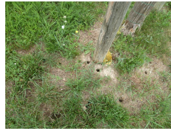
Présence de campagnols des champs