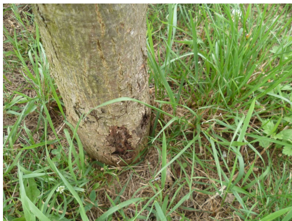
Dégâts de campagnols des champs sur tronc